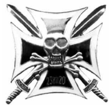
Odznaka „Huzarów Śmierci” wz. 1920